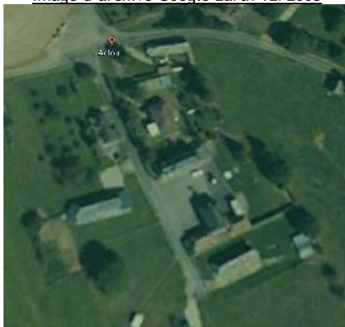
Image d'archive Google Earth 12/2005

2- Présenter le(s) projet(s) de la commune sur les parcelles récemment acquises, riveraines aux parcelles A151 et A340, et préciser si un bornage a été effectué (A0535).